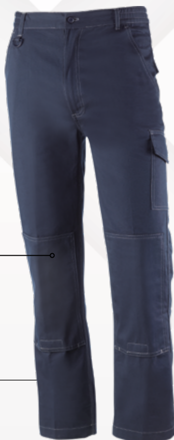
839BL Azul Marino Azul Marinho