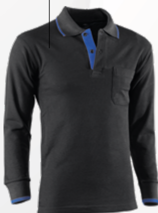
617 Negro-Azulina Preto-Azulado