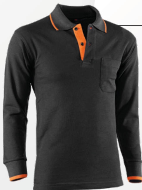
618 Negro-Naranja Preto-Laranja