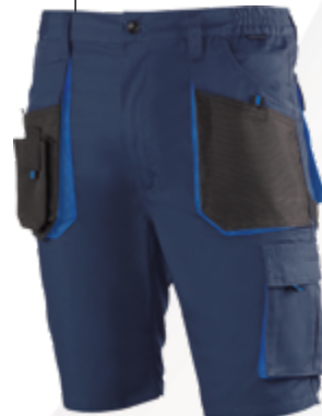
982 Marino-Negro Azul marinho-Preto