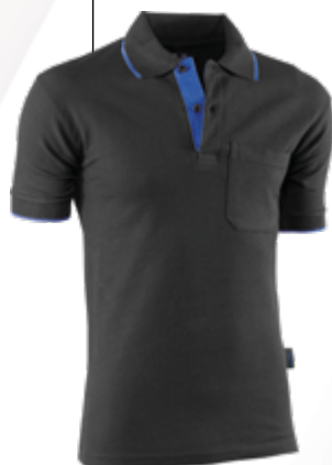
648 Negro-Azulina Preto-Azulado