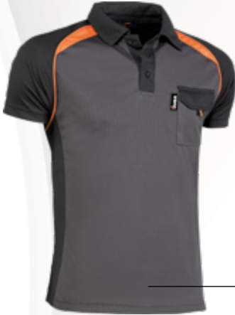
964 Gris oscuro-Negro-Naranja Cinzento escuro-Preto-Laranja