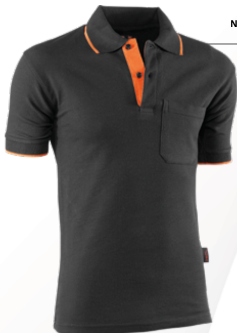
647 Negro-Naranja Preto-Laranja