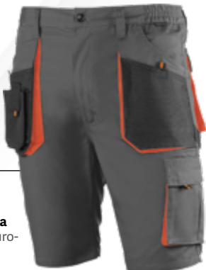
962 Gris oscuro-Negro-Naranja Cinzento escuro-Preto-Laranja

Tallas: S(38/40) | M(42/44) | L(46/48) | XL(50/52) XXL(54/56) | 3XL(58/60)